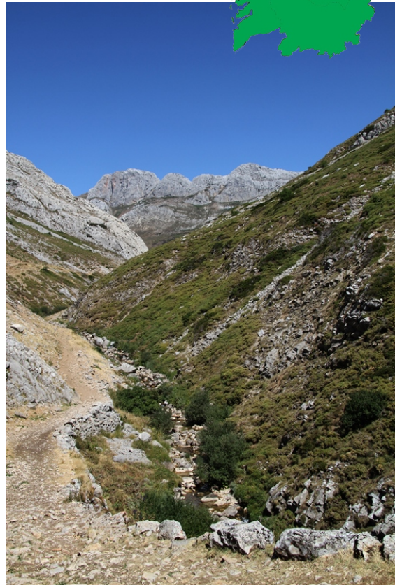
O Sil no comezo da ruta