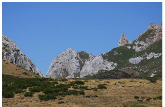
Entrada ao Val de Somiedo