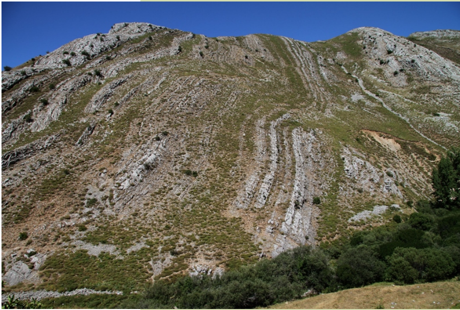
Pregues nas calcarias das Chanas.