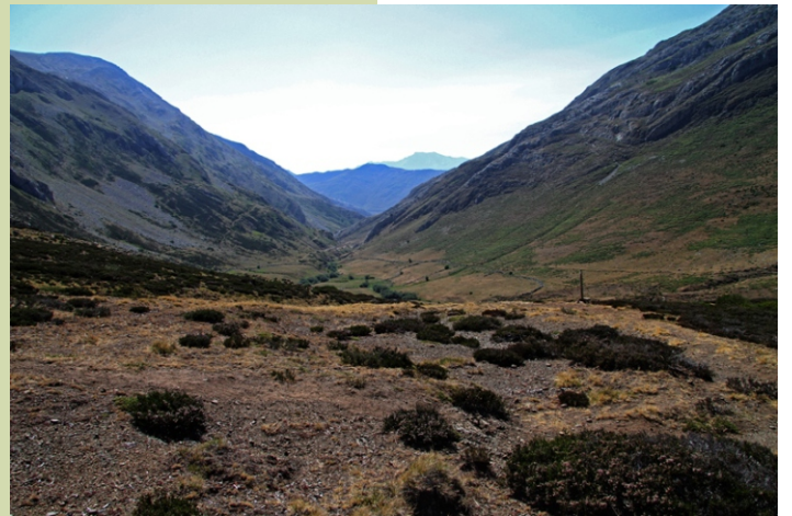
Val do Sil desde Covalancho.