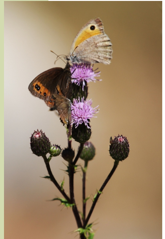
Tres especies de bolboretas a nun cardo.