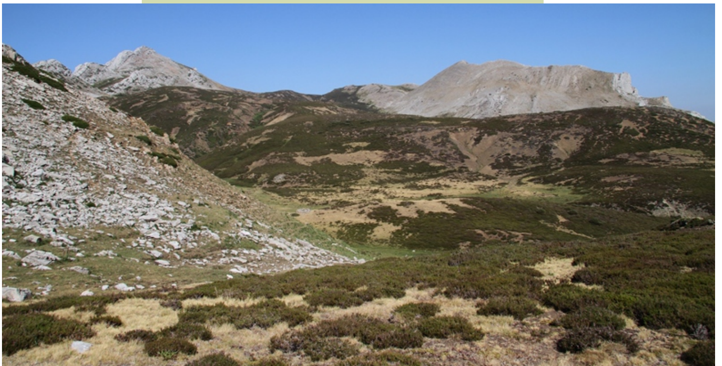
As nacentes do Sil, ao fondo (á esquerda) Peña Oriz e abaixo a mallada de Cuetalbo.